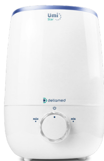
Umificador Umi Star