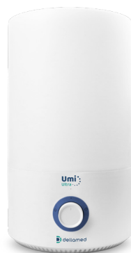
Umificador Umi Ultra