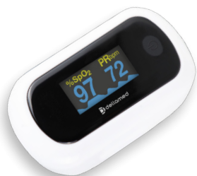
Oxímetro com Alarme de Emergência