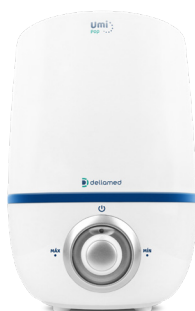
Umificador Umi Pop